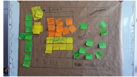
Ilustración 9.14 Análisis del centro educativo