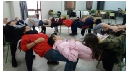
Ilustración 9.2 La unión hace la fuerza.