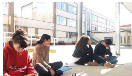
Ilustración 9.6 Roll playing sobre HH. SS