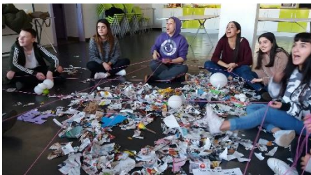
Ilustración 9.15 Tejiendo la red