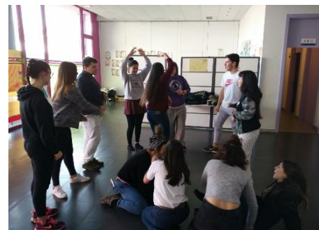
Ilustración 9.10 Convivencias