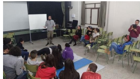
Ilustración 9.16 Taller Rap, La Kalle