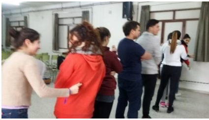
Ilustración 9.1 Comunicación verbal/no verbal.

Todas las imágenes que se adjuntan son de elaboración propia y previo consentimiento de las/as participantes.