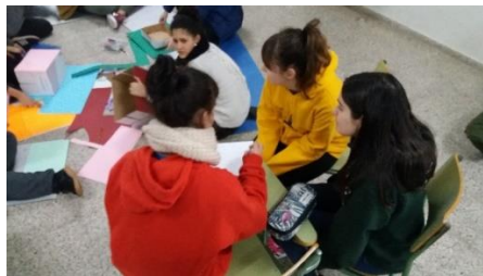
Ilustración 9.17 Elaboración de guion