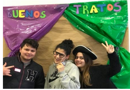
Ilustración 9.12 Convivencias