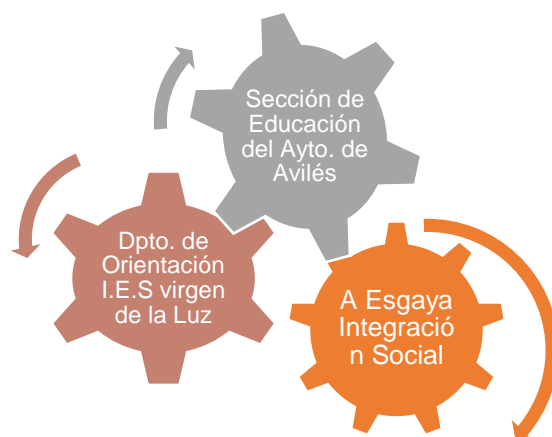
Ilustración 1. Colaboración entre diferentes instituciones.

El proyecto “Buenos Tratos” nace como una experiencia promovida por la Asociación A Esgaya – Integración Social en colaboración con el Ayuntamiento de Avilés, como entidad financiera a través del Área de Promoción Social y Cultural desde la Sección de Educación y el Instituto de Educación Secundaria Obligatoria Virgen de La Luz, como coordinador del proceso a través del Departamento del Orientación.