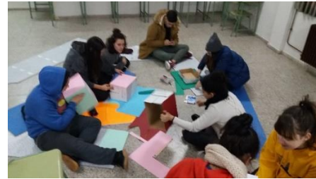
Ilustración 9.18 Elaboración de buzones