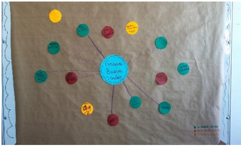
Ilustración 9.13 Mapa de recursos