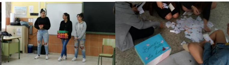
Ilustración 9.21 Presentación actividad Ilustración 9.21 Recogida cartas