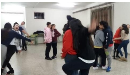
Ilustración 9.3 Abrazos.