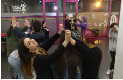
Ilustración 9.11 Convivencias