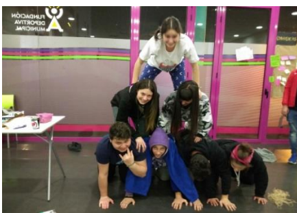
Ilustración 9.9 Convivencias