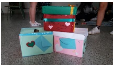
Ilustración 9.20 Buzones