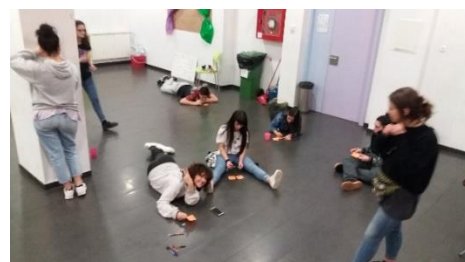
Ilustración 9.8 Convivencias