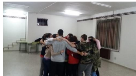
Ilustración 9.4. Abrazo grupal