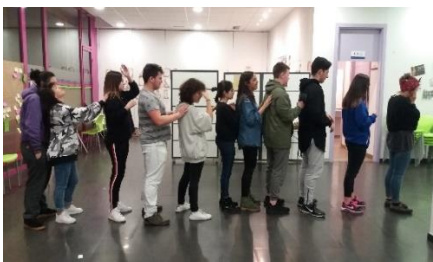
Ilustración 9.7 Convivencias