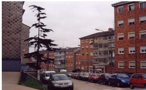
Ilustración 4.1 Fotografía del barrio de La Luz (Adams, 2003)

El barrio de La Luz se sitúa en el sur de la comarca avilesina, se encuentra en el extrarradio. Comienza a construirse en el año 1959 con la intención de albergar a los obreros de Ensidesa (Proyecto Educativo I.E.S Virgen de La Luz, 2011). Estas se construyen en línea recta y escalonada hacia arriba. Son pequeñas y sin ascensor. En los años 60 comenzaron a llegar los primeros habitantes, llegando a ser 5.828 personas a finales de la década. El barrio sufrió una fuerte regresión demográfica por la gran disminución de la natalidad en los años 90. Entre su población hay muchas personas de León y Andalucía que se trasladaron para trabajar en la fábrica Ensidesa. También cuenta con gran población de etnia gitana, los poblados chabolistas que el Ayuntamiento de Avilés quiso erradicar con el Plan de Realojamiento e Integración en el año 1997 estaban situados justo al lado del barrio, pero también en zonas del mismo. A partir del año 2000 en adelante, se consigue llegar a más de 10.000 habitantes con la construcción de nuevos bloques de viviendas lo que hace que se instale mucha gente joven (Adams, 2003).